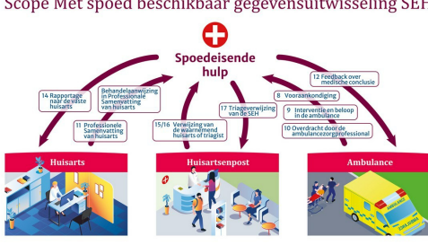
Scope Met spoed beschikbaar gegevensuitwisseling SEH